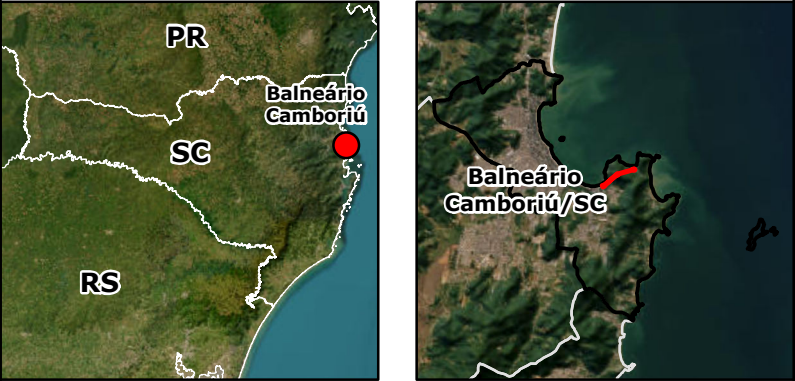
Imagem: Basemap - ArcGIS Divisas Municipais: IBGE (2024) Classificação Climática de Köppen: ALVARES et al. (2013)